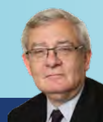
VICE-PRÉSIDENT Jean Lemierre Président de BNP Paribas